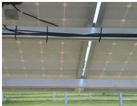
Abbildung 16: Kabelbinder halten die Kabel am Modul.