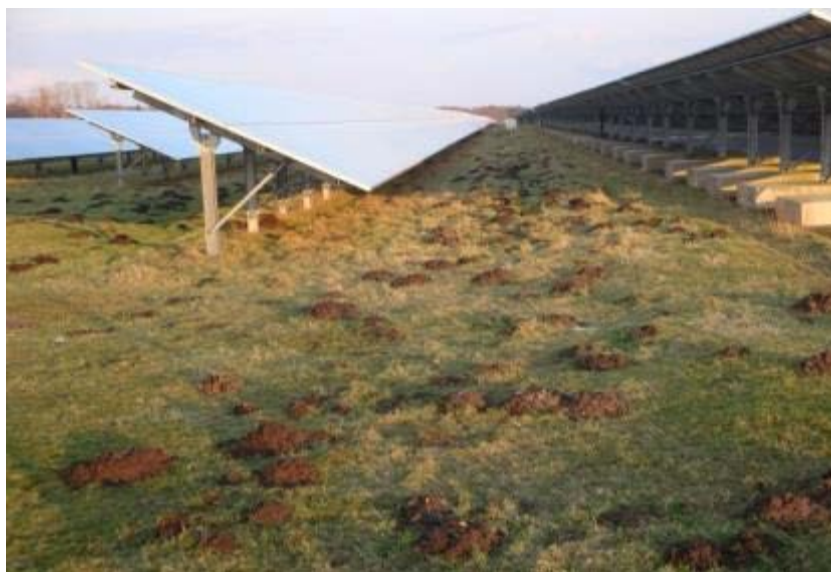
Abbildung 3: Auf Grund der Maulwurfshügel könnte diese Fläche nicht gemäht werden. Eine Schafbeweidung ist hier problemlos möglich und tritt zudem die entstandenen Löcher und Gänge zu (Foto: K. Gerdes, Solarpark Fliegerhorst Oldenburg).