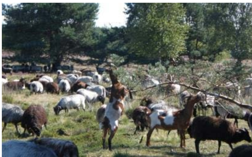
Abbildung 7: Im Gegensatz zu Schafen können sich Ziegen auf die Hinterbeine stellen und somit leicht die Solarpanele beschädigen.

Der Einsatz von Ziegen in PV-Anlagen muss sorgfältig abgewogen werden. Für den Einsatz der Ziegen spricht ihre Pflegeleistung, d.h. eine Nachmahd ist eventuell nicht erforderlich. Gegen den Einsatz von Ziegen sprechen ihre Neugier und Kletterfreude (Ausbrechen, Beschädigungsrisiko, vgl. Abbildung 7). Ziegen sollten generell nur in Mover-Anlagen eingesetzt werden.