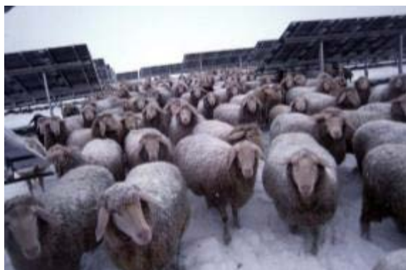
Abbildung 26: PV-Anlagen-Beweidung im Winter.

Prinzipiell können die Anlagen je nach Lage ganzjährig beweidet werden (vgl. Abbildung 26, Abbildung 27), am häufigsten wird auf Grund der Winterwitterung jedoch vom Frühjahr bis zum Herbst beweidet. Die Schafe/Ziegen nutzen dabei die Module als Watterschutz gegen Sonne, Wind, Regen und Schnee. Bei ganzjähriger Beweidung bietet sich aber ein zusätzlicher Unterstand an. Solche Liegestellen weisen nicht nur eine erhöhte Nährstoffzufuhr auf, sondern sind oft auch Stellen mit der höchsten Parasitenbelastung. Dies muss vom Schäfer registriert und bei Bedarf entsprechend Abhilfe geleistet werden (Auszäunen, Portionsweiden etc.).