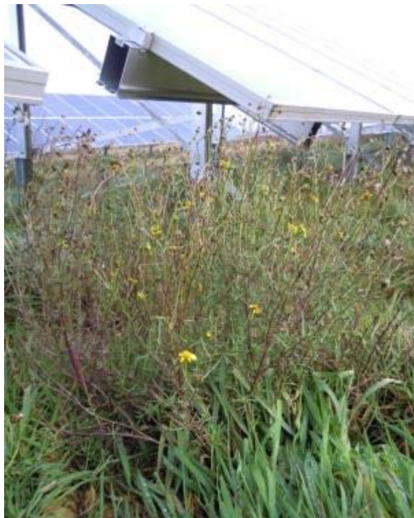
Abbildung 24: Ein Verdacht auf Giftpflanzen muss mit Hilfe von Fachpersonen ausgeräumt werden.

Nach Ende der Beweidungssaison sollte sich der Schafhalter die Zeit nehmen, den Bestand nochmals genauer anzuschauen und den Beweidungserfolg zu kontrollieren. Nur so ist er in der Lage, mögliche Fehlentwicklungen des Bestandes frühzeitig zu bemerken und im nächsten Jahr die Beweidung z.B. durch eine geringere Besatzdichte oder eine frühere Nutzung anzupassen.