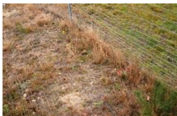
Abbildung 22: Eingewachsene Maschendrahtzäune (Zaunschürzen) verhindern das Untergraben effektiv, sind aber aufwendig (Foto: W. Fischer, LLG Sachsen-Anhalt).