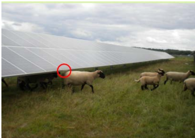
Abbildung 8: Die Mindesthöhe der Solarpaneele sollte 80 cm sein.

Außerdem besteht bei zu niedrig aufgehängten Paneelen die Gefahr, dass die Module durch die Schafe beschädigt werden. Dies gilt insbesondere bei Dünnschichtmodulen . Die Rahmung ist wenig stabil. Sie können im Unterschied zu kristallinen Modulen lediglich durch Klammern gehalten sein. Bei mechanischer Belastung kann es schnell zu Brüchen kommen (vgl. Abbildung 9).