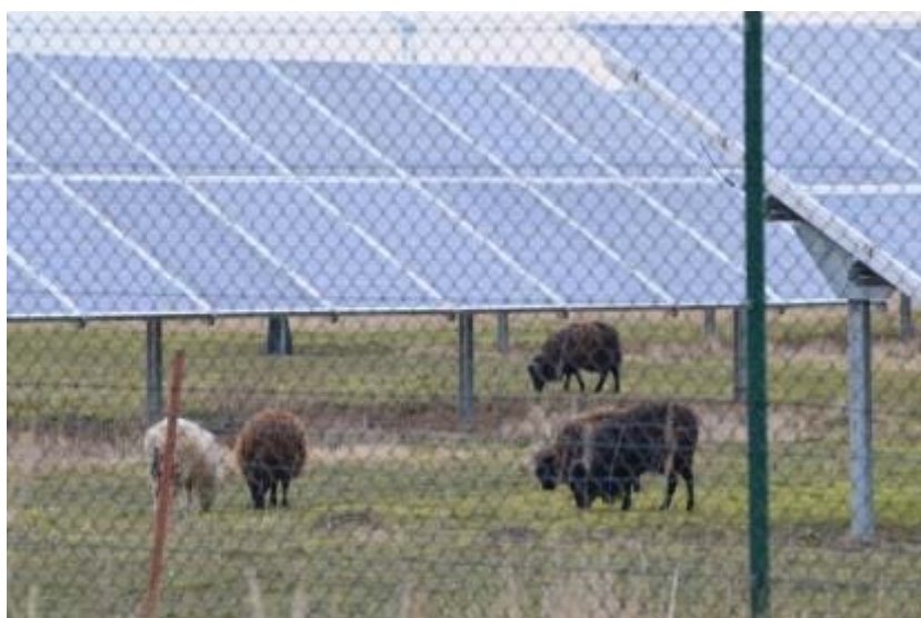
Abbildung 11: Ouessants – die kleinste europäische Schafrasse – bei der Pflege einer Photovoltaikanlage.

Falls diese Voraussetzungen nicht erfüllt sind, lassen sich kleine Landschaftsrassen für die Beweidung einsetzen. Hier bieten sich z.B. Shropshire (KIEMER 2016) oder Ouessants (JURKSCHAT 2016, vgl. Abbildung 11) an.