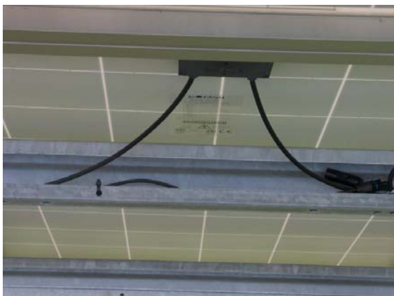
Abbildung 17: Verlegung der Kabel im Ständerprofil.