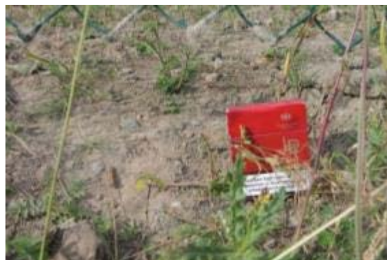
Abbildung 20: Maschendrahtzäune ohne Bodenschluss heben die Schafe mit dem Kopf an und unterkriechen diesen (insbesondere Lämmer und kleine Rassen).

Als Lösung bietet es sich an, eine stromführende Litze zu ziehen (vgl. Abbildung 21): 20 cm über dem Boden und mit 20 cm Abstand zum Zaun (innen gegen das Ausbrechen der Schafe, außen vor allem in Wolfsgebieten gegen das Eindringen von Beutegreifern). Die Litze muss jedoch regelmäßig freigeschnitten werden. Bei Einzäunungen aus Maschendraht sollte diese Litze auch angebracht werden, wenn der Bodenschluss gegeben ist, damit die Tiere den Zaun nicht anheben und darunter durchschlüpfen sowie langfristig beschädigen. In diesem Fall müsste der Schäfer für den Schaden am Zaun aufkommen (REBITZER 2010). Teilweise werden Netze auch zerschnitten, vor dem Außenzaun angebracht und einwachsen gelassen (Zaunschürze). So können die Schafe nicht ausbrechen und ein Freischneiden ist unnötig (KIEMER 2016, vgl. Abbildung 22).