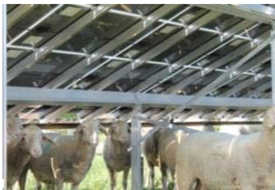
Abbildung 27: PV-Anlagen Beweidung im Sommer (Foto: R. Kiemer).