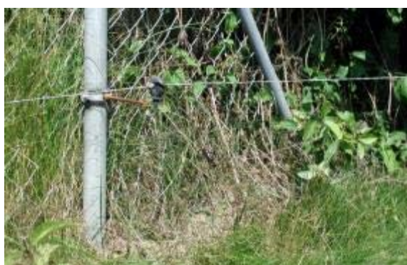
Abbildung 21: Eine innen angebrachte, unter Strom stehende Litze verhindert das Untergraben des Maschendrahtzauns durch Schafe.

Als Lösung bietet es sich an, eine stromführende Litze zu ziehen (vgl. Abbildung 21): 20 cm über dem Boden und mit 20 cm Abstand zum Zaun (innen gegen das Ausbrechen der Schafe, außen vor allem in Wolfsgebieten gegen das Eindringen von Beutegreifern). Die Litze muss jedoch regelmäßig freigeschnitten werden. Bei Einzäunungen aus Maschendraht sollte diese Litze auch angebracht werden, wenn der Bodenschluss gegeben ist, damit die Tiere den Zaun nicht anheben und darunter durchschlüpfen sowie langfristig beschädigen. In diesem Fall müsste der Schäfer für den Schaden am Zaun aufkommen (REBITZER 2010). Teilweise werden Netze auch zerschnitten, vor dem Außenzaun angebracht und einwachsen gelassen (Zaunschürze). So können die Schafe nicht ausbrechen und ein Freischneiden ist unnötig (KIEMER 2016, vgl. Abbildung 22).