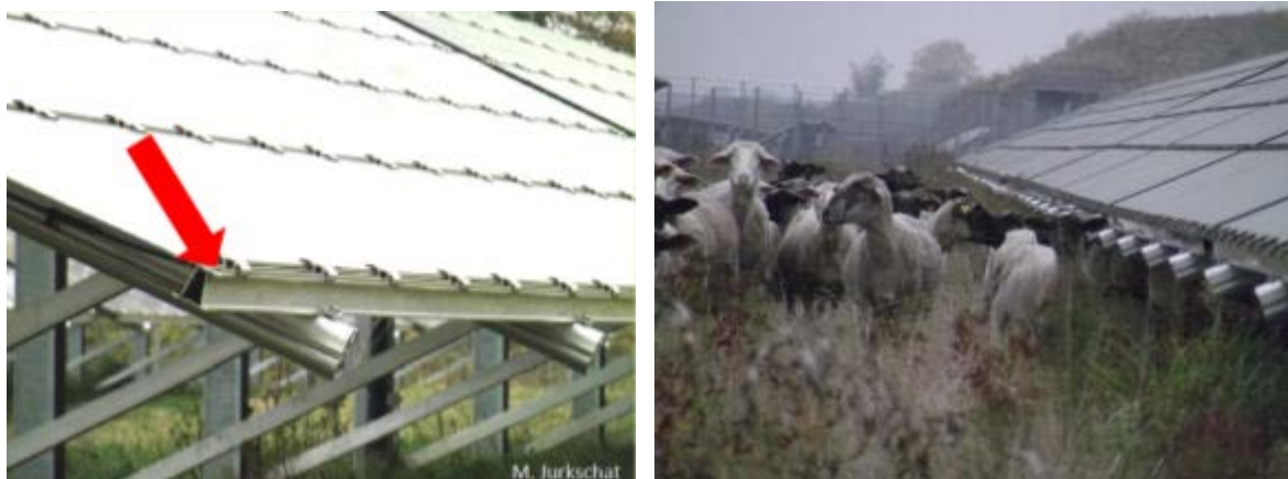
Abbildung 10 a und b: Stabil aufgehängte Dünnschichtmodule - Selbst bei niedriger Höhe werden Anlagen mit Dünnschichtmodulen bei dieser Art der Aufhängung mit großen Schafen problemlos beweidet (Fotos: JURKSCHAT & SCHALOW 2014).

Falls diese Voraussetzungen nicht erfüllt sind, lassen sich kleine Landschaftsrassen für die Beweidung einsetzen. Hier bieten sich z.B. Shropshire (KIEMER 2016) oder Ouessants (JURKSCHAT 2016, vgl. Abbildung 11) an.