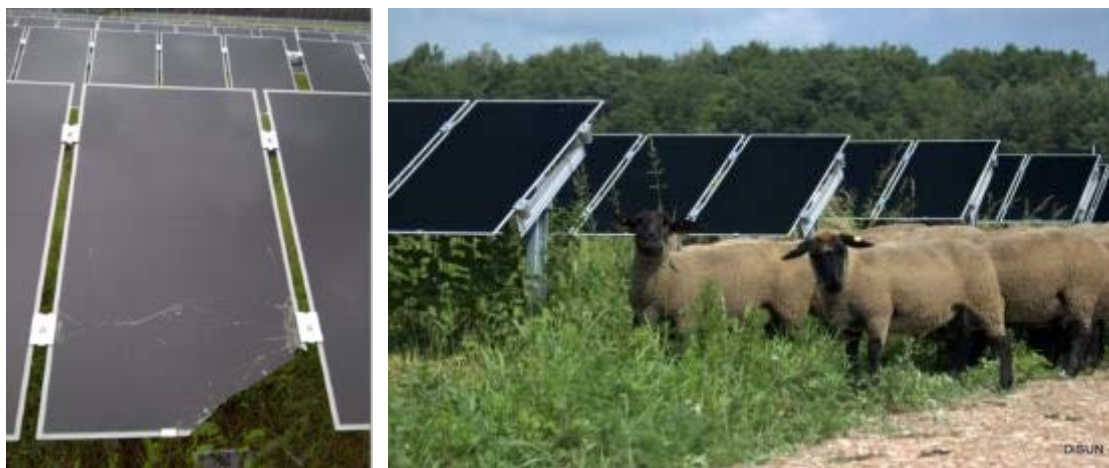
Abbildung 9a und b: Schädigung von niedrig aufgehängten Dünnschichtmodulen durch Schafe (Hunde von Spaziergängern verschreckten die Schafe).

Außerdem besteht bei zu niedrig aufgehängten Paneelen die Gefahr, dass die Module durch die Schafe beschädigt werden. Dies gilt insbesondere bei Dünnschichtmodulen . Die Rahmung ist wenig stabil. Sie können im Unterschied zu kristallinen Modulen lediglich durch Klammern gehalten sein. Bei mechanischer Belastung kann es schnell zu Brüchen kommen (vgl. Abbildung 9).