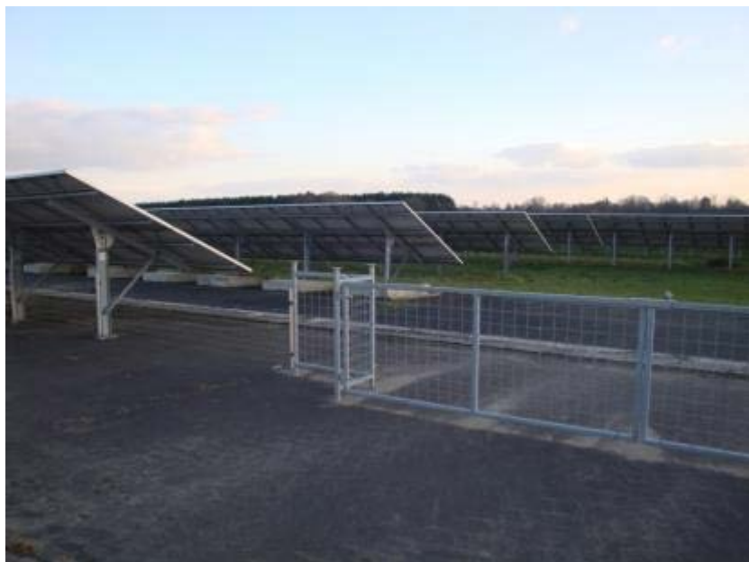
Abbildung 25: In größeren Anlagen stellt manchmal der Anlagenbetreiber selber bereits eine Unterteilung mit festen Zäunen und Toren zur Verfügung (Foto: K. Gerdes, Solarpark Fliegerhorst Oldenburg).

Auch ein Abhüten der Fläche ist möglich, wenn auch schwierig, da die Herde schlecht zu sehen ist und der Hütehund nur bedingt zwischen den Modulen arbeiten kann. Diese Nutzungsform eignet sich vor allem für hohe Mover-Anlagen ohne Außenzaun.