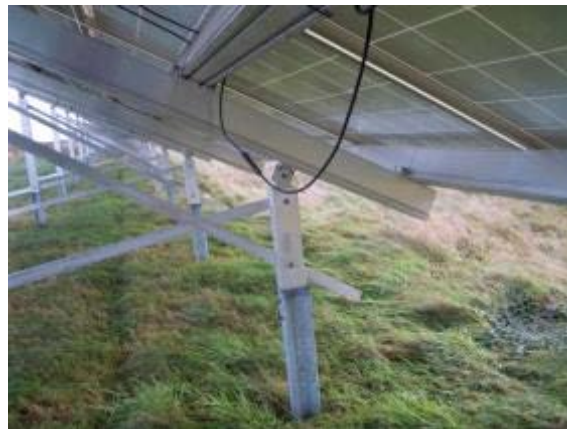
Abbildung 14: Die Kabel wurden leider nicht in die vorhandenen Kabelschächte gelegt und stellen so eine Gefahr dar.