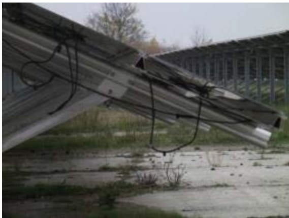
Abbildung 13: Freihängende Kabel stellen eine Gefahr für die Tiere und die Funktionalität der Panele dar.

Schafe und auch Ziegen können die Kabel anfressen und dadurch sehr hohe Ausfallkosten verursachen. Es passiert auch, dass sich die Schafe in den Kabeln verhängen und verletzen. Daher müssen alle Kabel in der Anlage entweder für die Tiere unerreikbaar sein oder entsprechend geschützt werden. Es dürfen keine Kabelschlaufen nach unten hängen (vgl. Abbildung 13, Abbildung 14)!