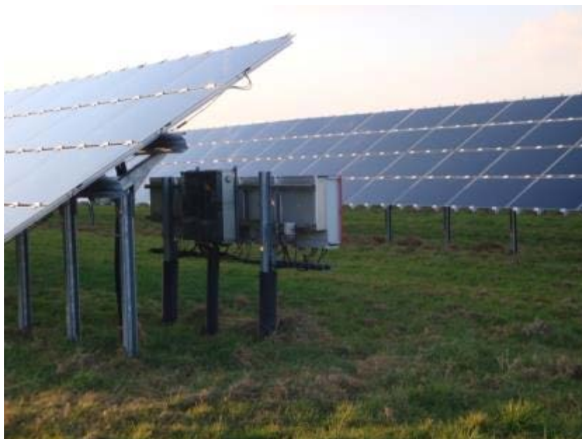
Abbildung 23: Wechselrichter müssen vor einer Schafbeweidung umzäunt oder anderweitig gegen Verbiss gesichert werden (Foto: K. Gerdes, Solarpark Fliegerhorst Oldenburg).

Da vor allem die Wechselrichterbänke schützenswert sind, macht es Sinn diese zusätzlich z.B. mit Maschendrahtzaun oder Gittern gegen eine Beschädigung durch die Schafe einzuzäunen (vgl. Abbildung 23). Ob dies der Betreiber oder der Schafhalter vornimmt, ist im Vertrag zu regeln.