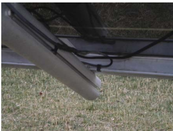
Abbildung 15: Kabel werden direkt unter den Panelplatten verlegt