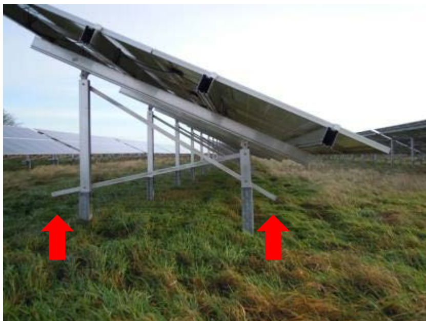
Abbildung 12: Vorstehende Flacheisen können Mensch, Hund und Schaf verletzen (Foto: M. Gertenbach, LWK Niedersachsen).