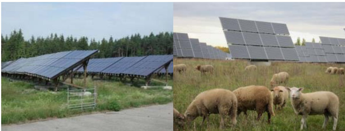
Abbildung 1: PV-Anlage mit festen Modulen (Quelle: C. Mendel, LfL).

Für die Schafbeweidung sind nur Freiflächenanlagen geeignet. Die Solarmodule werden dabei hintereinander in langen Reihen oder Feldern auf Unterkonstruktionen platziert. Die Module können hinsichtlich ihrer Sonnenausrichtung fest montiert (s. Abbildung 1) oder variabel (Mover bzw. Tracker, s. Abbildung 2) sein. Die Mover haben den Vorteil, dass sie im Tagesverlauf dem Stand der Sonne folgen, so dass ein höherer Ertrag erwirtschaftet wird.