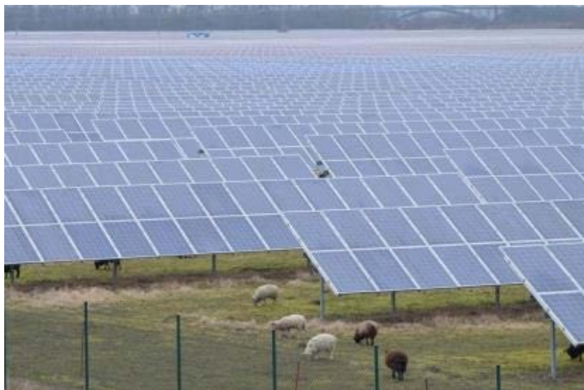
Abbildung 4: Die Größe der bebauten Flächen kann von einigen wenigen bis zu mehreren 100 ha reichen. Sowohl für kleine Bestände als auch für große Herdenschäfereien können Photovoltaikfreiflächenanlagen von großem Interesse sein

Gleichzeitig stellt die Beweidung auch aus Sicht des Naturschutzes eine sehr geeignete Nutzung der PV-Anlagen-Fläche dar (LFU 2014), denn: