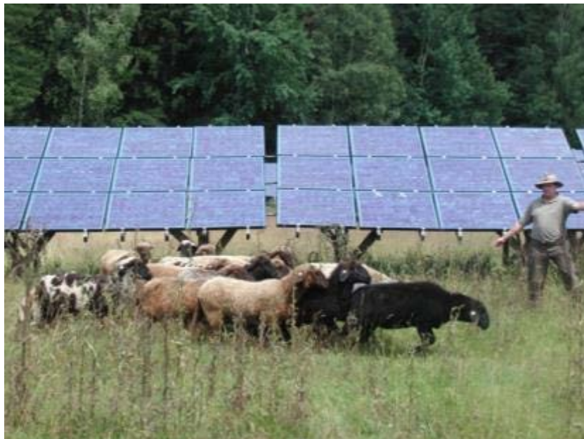
Abbildung 6: Bergschafe in der PV-Anlagen-Beweidung (Foto: C. Mendel, LfL).

Beweidung der PV-Anlagen eingesetzt, ohne das in diesen Anlagen bislang Schäden entstanden wären (REBITZER 2016). Einige Betreiber lehnen jedoch horntragende Rassen ab, da sie vermehrt Beschädigungen der Anlage fürchten.