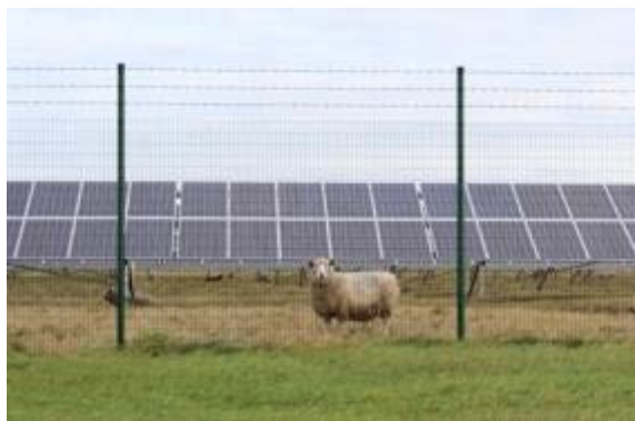
Abbildung 19: Ein stabiler Stabgitterzaun mit Bodenschluss ist für die Schafbeweidung optimal (Foto: M. Gertenbach, LWK Niedersachsen. Solarpark in Ovelgönne, Landkreis Wesermarsch).

Der Außenzaun wird aus sicherheits- und haftungsrechtlichen Gründen in der Regel durch die Betreiberfirma gestellt und ist häufig über 2 m hoch (LFU 2014). Der Schafhalter sollte jedoch prüfen, ob der Zaun auch einen hinreichenden Bodenabschluss hat (vgl. Abbildung 19). Häufig wird aus Gründen der Wilddurchgängigkeit der Zaun mit mindestens 15-20 cm Abstand vom Boden errichtet. Lämmer können so aus dem Gelände ausbrechen, aber auch Füchse können eindringen (REBITZER 2010, vgl. Abbildung 20).