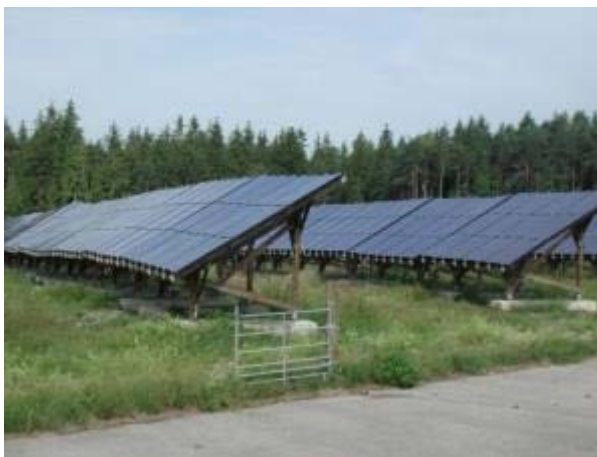
Abbildung 1: PV-Anlage mit festen Modulen.

Für die Schafbeweidung sind nur Freiflächenanlagen geeignet. Die Solarmodule werden dabei hintereinander in langen Reihen oder Feldern auf Unterkonstruktionen platziert. Die Module können hinsichtlich ihrer Sonnenausrichtung fest montiert (s. Abbildung 1) oder variabel (Mover bzw. Tracker, s. Abbildung 2) sein. Die Mover haben den Vorteil, dass sie im Tagesverlauf dem Stand der Sonne folgen, so dass ein höherer Ertrag erwirtschaftet wird.