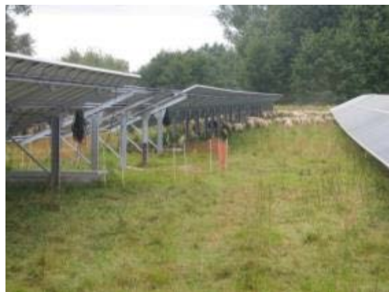
Abbildung 18: Bereiche mit freihängenden Kabeln sind auszuzäunen.

Für schlecht verlegte Kabel kann der Schäfer nicht zuständig und verantwortlich sein. Vor Beginn der Beweidung und während der täglichen Tierkontrollen muss er aber zwingend die ganze Anlage entsprechend kontrollieren und bei Bedarf den Betreiber auf Missstände hinweisen.