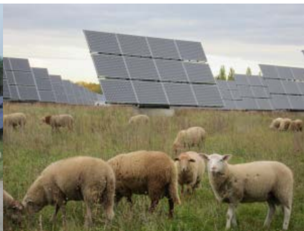
Abbildung 2: PV-Anlage mit Movern bzw. Trackern.

Gemessen am Gesamtmarkt für Photovoltaikanlagen in Deutschland machen ebenerdig errichtete Anlagen einen vergleichsweise kleinen Teil aus: Gegen 2010 hieß es, ihr Anteil in Deutschland liege seit Jahren konstant zwischen 10 und 15 Prozent (WIKIPEDIA 2015). Der Hauptanteil der ebenerdigen Anlagen entfällt dabei auf die ostdeutschen Bundesländer, wo große Solarparks errichtet wurden. Im Süden und Westen Deutschlands wurden hingegen vorwiegend Aufdachanlagen installiert (STROMREPORT 2015). In Bayern sind beispielsweise nur 0,5 % aller Anlagen Freiflächenanlagen (LfU 2014). Sie nehmen in Bayern eine Fläche von ca. 6.900 ha (Stand 2014) ein (Energieatlas Bayern, ausgewertet von DITTFURT 2015). Aufgrund der rückläufigen Einspeisevergütung ist in den nächsten Jahren mit lediglich geringen Zuwächsen zu rechnen.