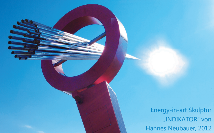
Energy-in-art Skulptur „INDIKATOR“ von Hannes Neubauer, 2012